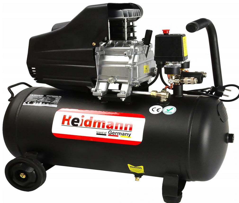
OLIECOMPRESSOR COMPRESSOR 50L 8bar HEIDMANN H00721

Een van de krachtigste 50 liter compressoren op de markt!